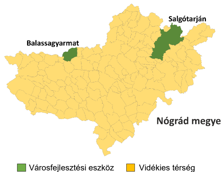
3. ÁBRA: KIJELÖLT FEJLESZTÉSI CÉLTERÜLETEK

A kijelölt fejlesztési célterületeket az alábbi térkép mutatja be: