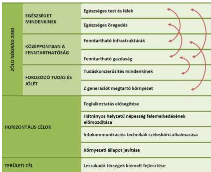
1. ÁBRA: NÓGRÁD MEGYE TERÜLETFEJLESZTÉSI PROGRAMJÁNAK CÉLRENDSZERE

Nógrád Megye Területfejlesztési Konceptiójának (2021-2027) javaslattevő fejezete rávilágít, hogy a felzárkóztatás stratégiai eszidáig nem hozták meg a várt eredményt, az elért fejlődési ütemmel a megye nem tudja utolérni az ország átlagos mutatóival rendelkező térségeit sem. Ebben a helyzetben a program offenzív fejlesztési logikára tesz javaslatot, amely az erősségekre és a lehetőségekre alapoz egy tematikusan felépített célrendszer mentén. A program célrendszerét és logikai összefüggéseit az alábbi ábra ismerteti: