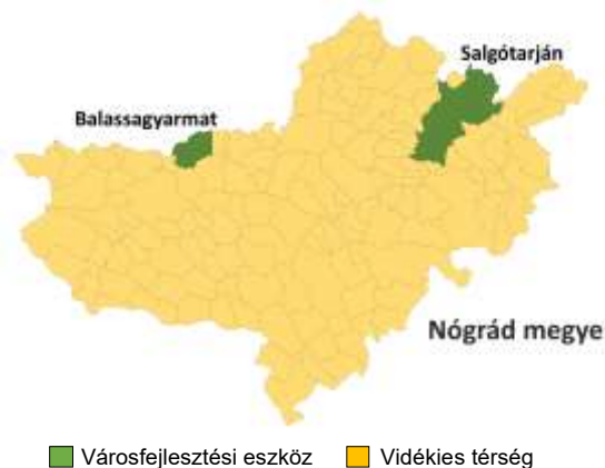
3. ÁBRA: KIJELÖLT FEJLESZTÉSI CÉLTERÜLETEK

A kijelölt fejlesztési célterületeket az alábbi térkép mutatja be: